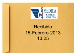
INTEGRAR LOS DOCUMENTOS EN UN SOBRE