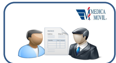
ENTREGAR PERSONALMENTE EN LAS OFICINAS DE CRÉDITO AFIANZADOR

Dirección: proteccion.datospersonales@gnp.com.mx