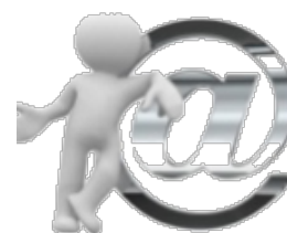
ENVIAR POR EMAIL