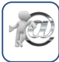
ENVIAR POR EMAIL