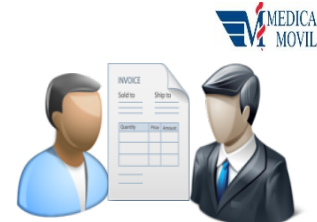
ENTREGAR PERSONALMENTE EN LAS OFICINAS DE MÉDICA MÓVIL

FIN DEL PROCEDIMIENTO PARA LA SOLICITUD DE MANERA FÍSICA.